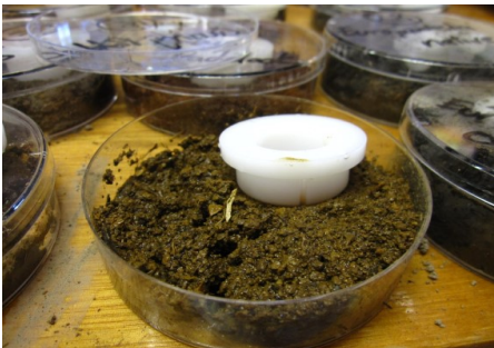
Billede 1: DGT på en jordoverflade. DGT'en indeholder en jernoxid-gel der absorberer fosfor på en måde, der minder om den måde en planterod optager fosfor på. Billede fra Mason 2017.

DGT-metoden til bestemmelse af den tilgængelige fosformængde i jord er en meget anderledes type af metode end fosfortalsmetoden. Fosfortalsmetoden er en jordekstraktionsmetode, hvor man ryster jorden med kemikaliet natriumbikarbonat i en given tid og derefter måler, hvor meget fosfor, der er blevet ekstraheret fra jorden. DGT-metoden efterligner mere den måde, hvorpå en planterod optager fosfor. En DGT består af en plasticenhed, der indeholder en jernoxid-gel, som kan absorbere fosfor. Når DGT'en placeres på en fugtig jordoverflade (se figur 1), vil fosfor fra jorden diffundere ind i DGT'en, og blive absorberet. Metoden har siden 2013 været anvendt kommercielt i Australien, hvor der årligt analyseres 3.-6.000 jordprøver med DGT.